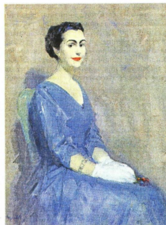
Омер Мујаџић, Портрет другарице Јованке Броз

Јасно је да оно што се данас види као колекција слика Јованке Броз можда више говори о