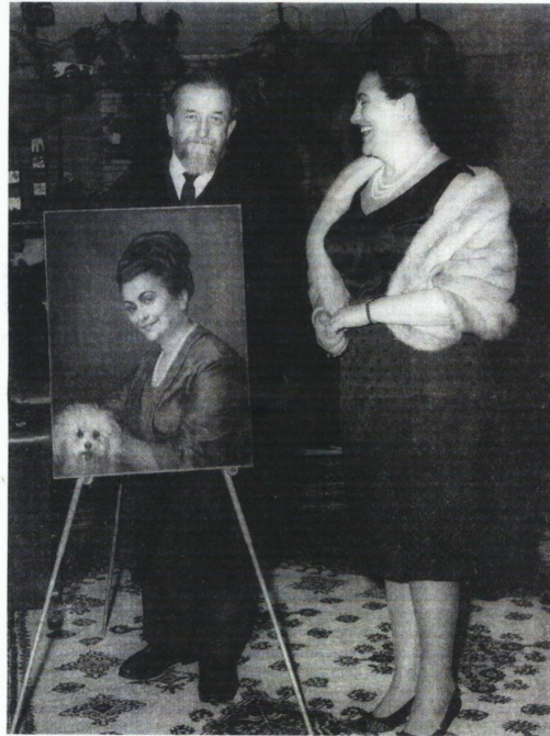
Јованка Броз са сликаром Божидаром Јакцем приликом фотографисања њеног портрета у вили на острву Ванга, Бриони, 8. фебруар 1966.

„Од 36 изложених слика трећина је поклоњена директно Јованки Броз са посветом написаном лично њој у периоду између 1965. и 1977. године. Остале су поклоњене Титу или су наменски набављане за уређење њиховог заједничког дома у Ужичкој 15, а после Титове смрти су Јованки додељене за уређење њеног новог дома. Пренете су слике које су се налазиле у просторијама које је она користила – женска канцеларија у приземљу, спаваћа соба на спрату, салон на спрату, радна соба на спрату, купатило и предсобље испред њега. Те приватне одаје Јованке Броз смо, у мери у којој је то било могуће, покушали да реконструисамо на изложби, долажући