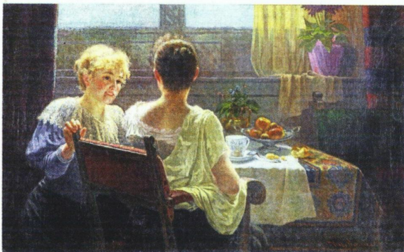
Влахо Буковац Жене у разговору , 1898.