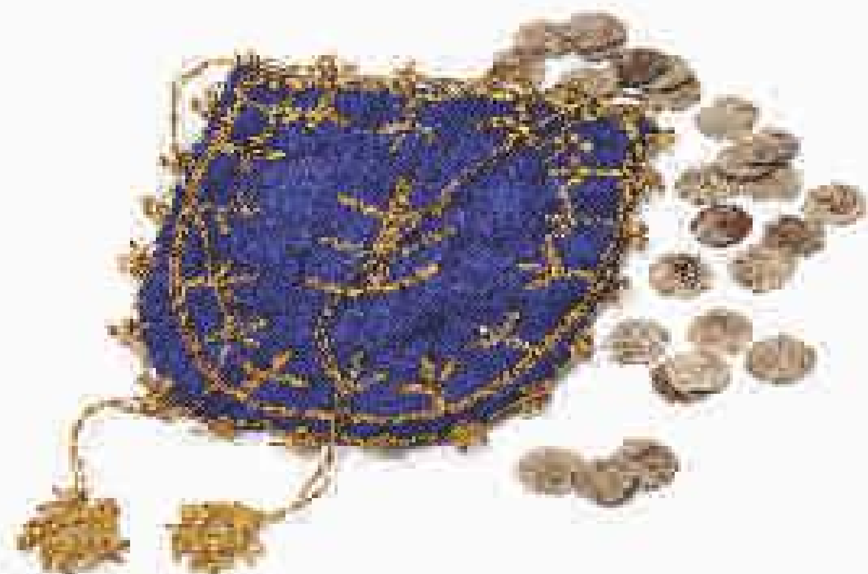
Врећица за новац какву су носиле имућније муслиманске девојке; Пријепоље, XIX век, свилени атлас, златовез; око ње су турски новчићи из Нумизматичке збирке Музеја.