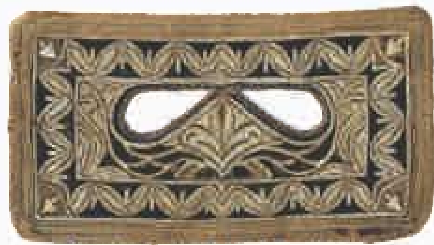
Печа, маска за лице, XIX век, Пријепоље, картон пресвучен чојом, вез памучним концем и срмом. Ношење оваквих маски био је један од видова покривања жена.