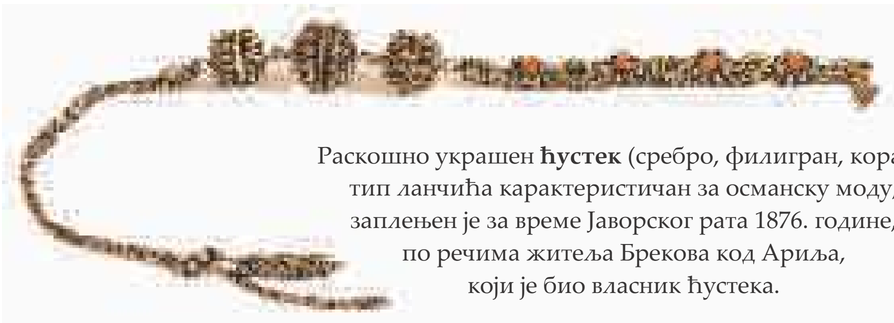
Раскошно украшен ђустек (сребро, филигран, корал), тип ланчића карактеристичан за османску моду, заплењен је за време Јаворског рата 1876. године, по речима житеља Брекова код Ариља, који је био власник ђустека.