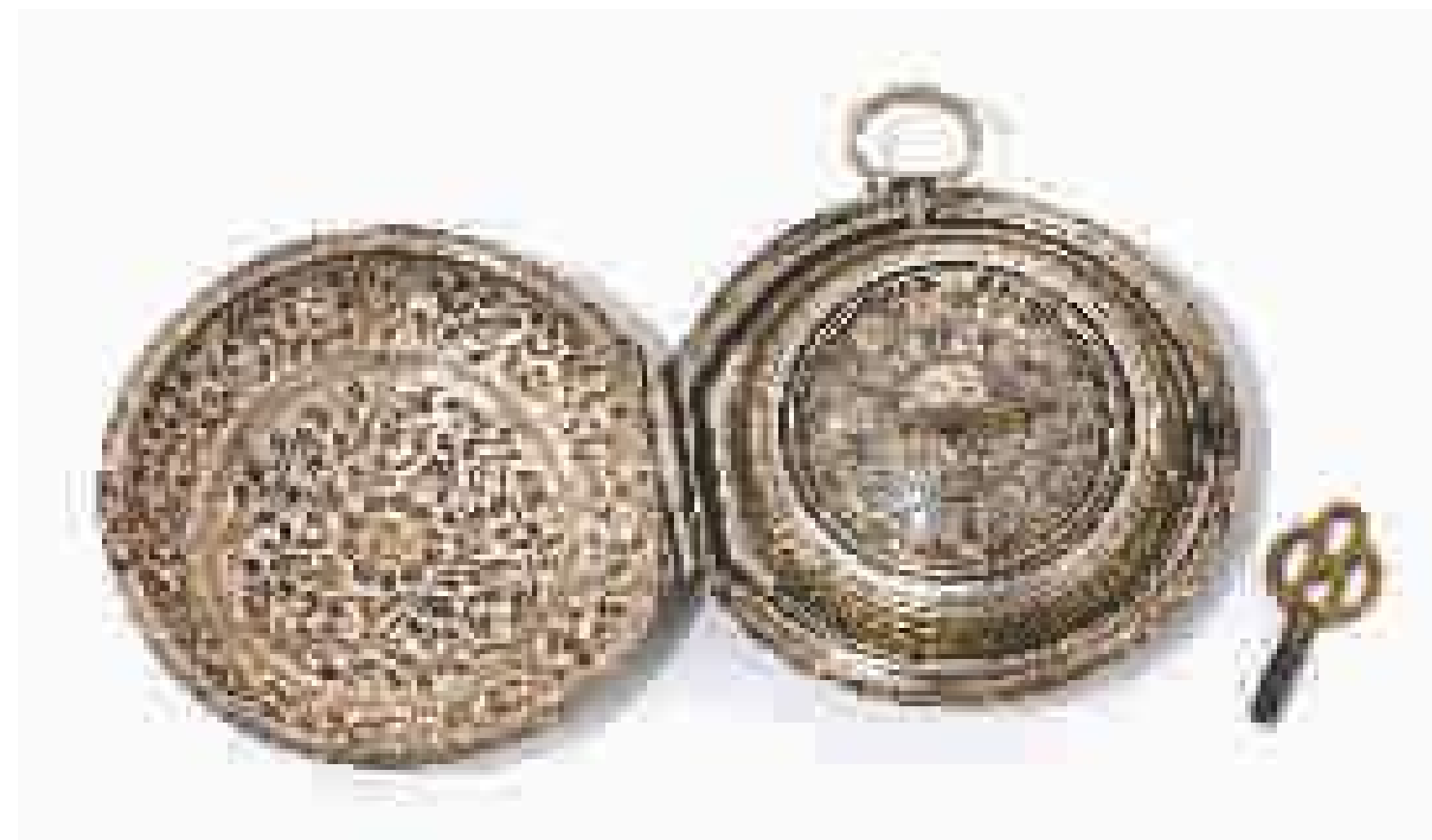
Сребрни сат, механизам израђен у фирми „Isac Rogers“ из Лондона, вероватно средином XVIII века, у сребрној кутији, која је свакако рад неког османског кујунџије.

Женске појасеве красиле су пафте, двоструке копче. Платнени појасеви украшавани су сребрним и златним нитима, а имућне жене могле су имати и појасеве од сребрних плочица. На појасеве је аплицирано и полудраго камење, попут ћилибара и карнеола.