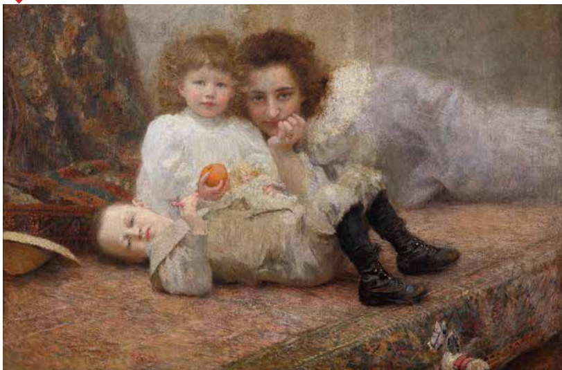
Moje gnijezdo, 1897, Moderna galerija, Zagreb

kensovske pustovine”, plovidba na dubrovačkom jedrenjaku, boravci u Njujorku, San Francisku, Južnoj Americi, razni poslovi kojima je zarađivao za život neprestano se boreći da postane ono što je bio – rođeni slikar,