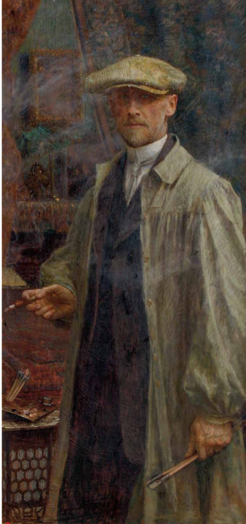
Autoportret, 1. deo diptiha, 1914, Kuća Bukovac, Cavtat, Muzeji i galerija Konavala

– uglavnom nepomerljiva sa svojih staništa, nisu mogla stići u Beograd. O njima se može saznati iz dokumentarnog filma koji se prikazuje na velikom ekranu, rađenom po scenariju Igora Zidića, u režiji Bogdana Žižića (Zagreb film, 1995). Ipak, zagrebački ciklus zastupljen je dobrim portretom Bele