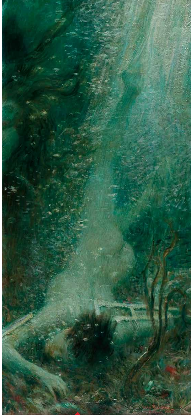
Ikarov pad, 2. krilo diptiha, 1898, Narodni muzej, Beograd

zuje na timski rad potreban da bi se stvorila dobra izložba.