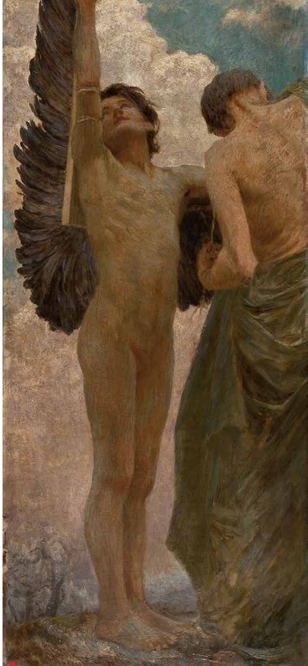
Ikar i Dedal, 1. krilo diptiha, 1898, Narodni muzej, Beograd

zuje na timski rad potreban da bi se stvorila dobra izložba.