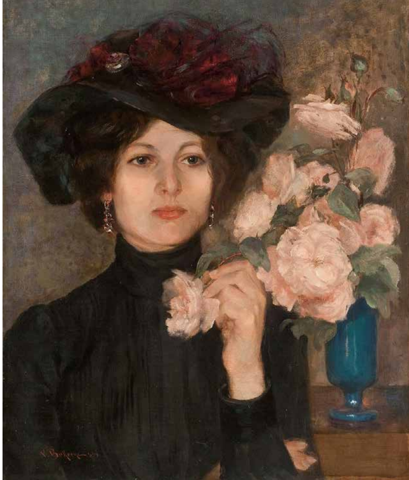
▲ Portret baronice Rukavine, 1898, Narodni muzej, Beograd

Najsloženiji i najsveobuhvatniji, idejno i tehnički najviše zahtevan, umno i fizički iscrpljujući, bio je Bukovčev zagrebački opus (1893-1898). U hrvatskoj prestonici Bukovac postaje istaknuti kulturni javni radnik, posvećen patriotskim temama,