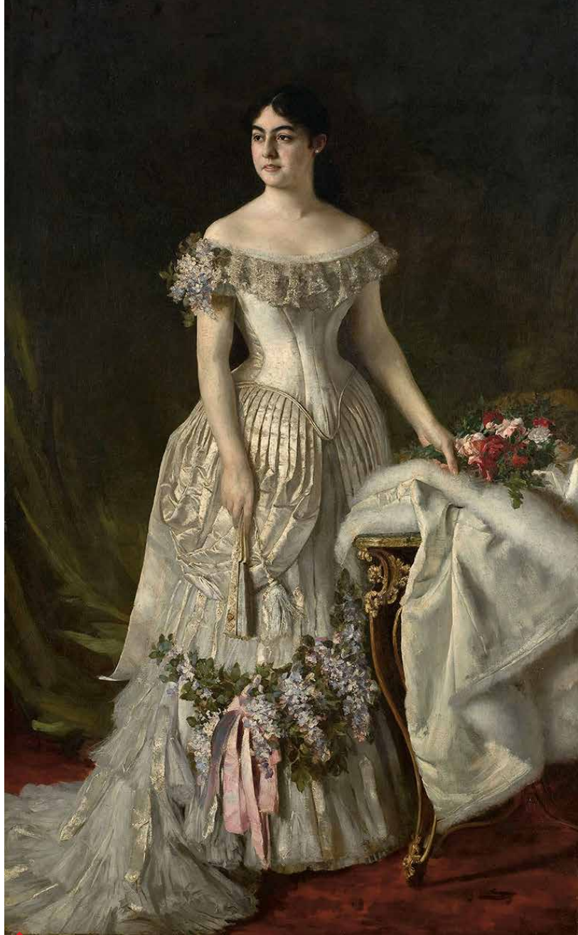
▲ Kraljica Natalija Obrenović, 1882, Narodni muzej, Beograd