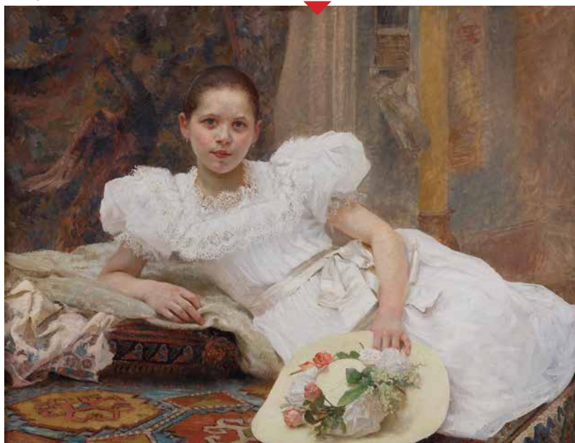
Kćerka Salomona Bergera, 1897, Moderna galerija, Zagreb

VEČITA PORUKA: Mada je Borozan mogao predstaviti mnoge Bukovčeve slike koje se čuvaju u srpskim institucijama kulture, i napuniti zidove Galerije SANU, on je izabrao samo one najbolje koje, pri tom, potvrđuju najizrazitije umetničke preobražaje slikara. Tako je, recimo, jednoj od najboljih u Bukovčevom opusu, diptihu Dedal i Ikar i Ikarov pad iz 1898 (Narodni muzej, Beograd), koji predstavlja tek probuđenu vedrinu i radoznalost mladosti i, istovremeno, njen teški sunovrat u ništavilo, darovan ceo zid. Posmatrač, zato, mora osetiti njenu večitu filozofsku poruku.