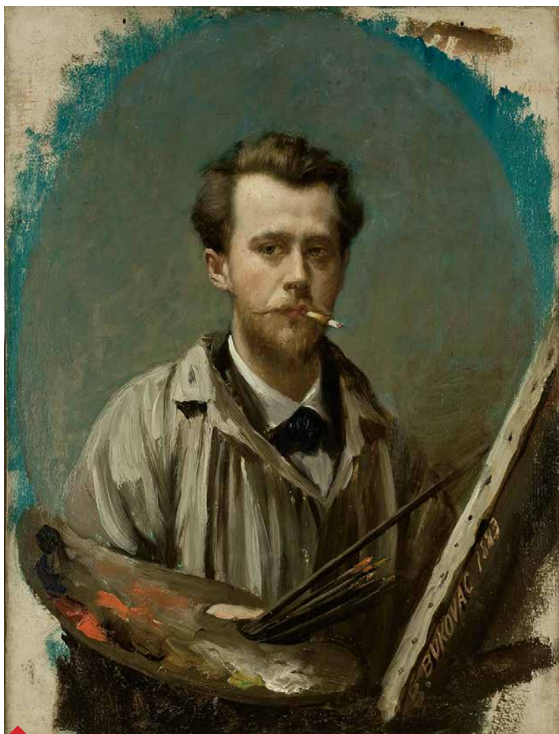
Autoportret, 1883, Narodni muzej, Beograd