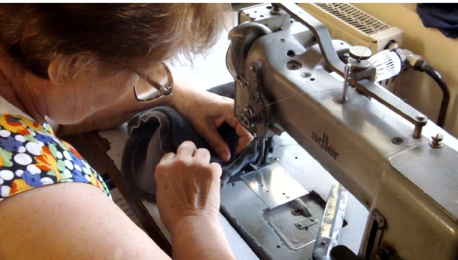
IZRADA PREDMETA (KAPE) OD KOZE