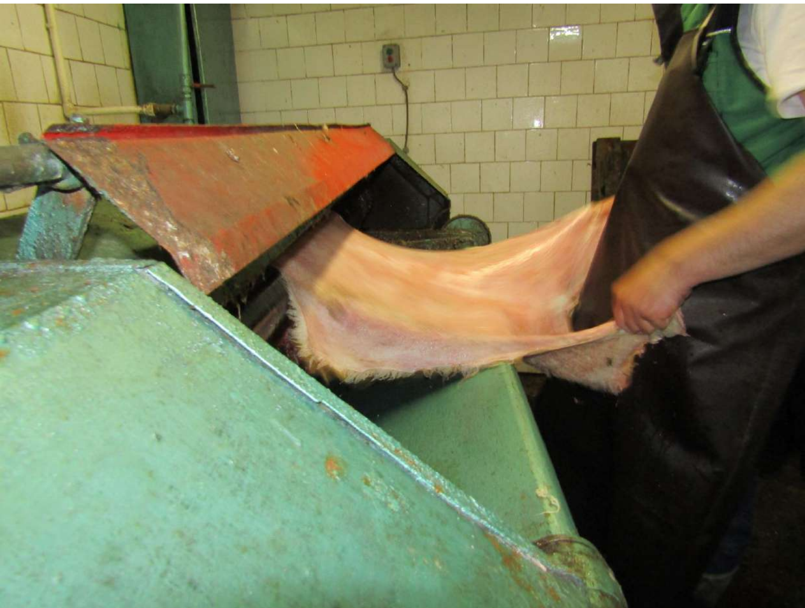
UKLANJANE MASNOCE SA KOZE