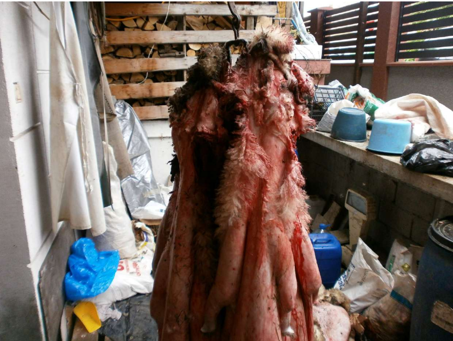
ORIPREMA KOZE ZA OBRADU