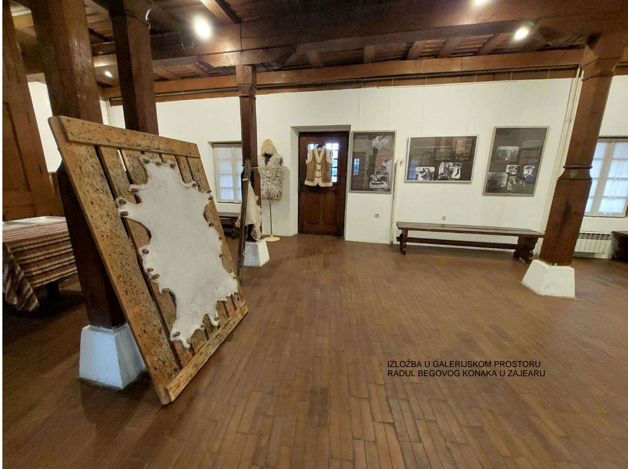
IZLOŽBA U GALERIJSKOM PROSTORU RADUL BEGOVOG KONAKA U ZAJEARU