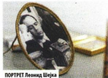
ПОРТРЕТ Леонид Шејка