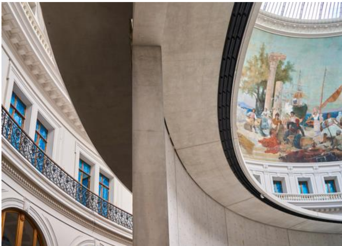
Слика 01. Берза – Пино колекција, Париз, 2021. (Тадао Андо)

Сходно претходно датим смерницама и препорукама у формирању простора које покривају широку скалу могућих приступа теми реконструкције, а ради што бољег увида у бројне могућности рада на задатку, конкурсним расписом се указује и на поједине референтне примере архитектуре из сличних области. Приказани и одабрани примери, који треба пре свега да илуструју неке од могућих савремених приступа у решавању сложеног задатка реконструкције, адекватни су и приликом разматрања могућих тема и програмских склопова.