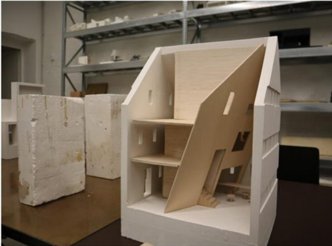
Слика 12. Макета реконструкције објекта (Сигурд Ларсен студио)