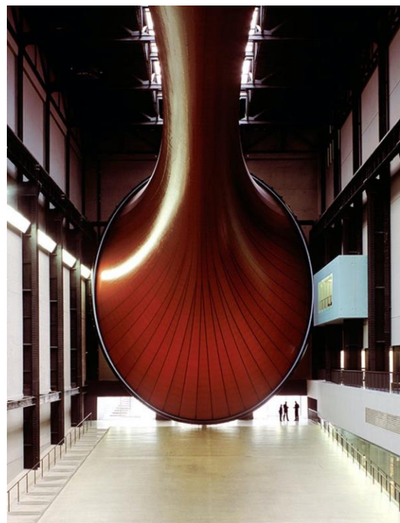
Слика 06 и 07. Музеј Тејт Модерн, Лондон, 2000. (Херцог & Де Мерон)