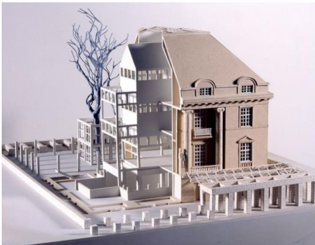
Слика 02. Музеј архитектуре Немачке, Франкфурт, 1979-84. (Матиас Унгерс)