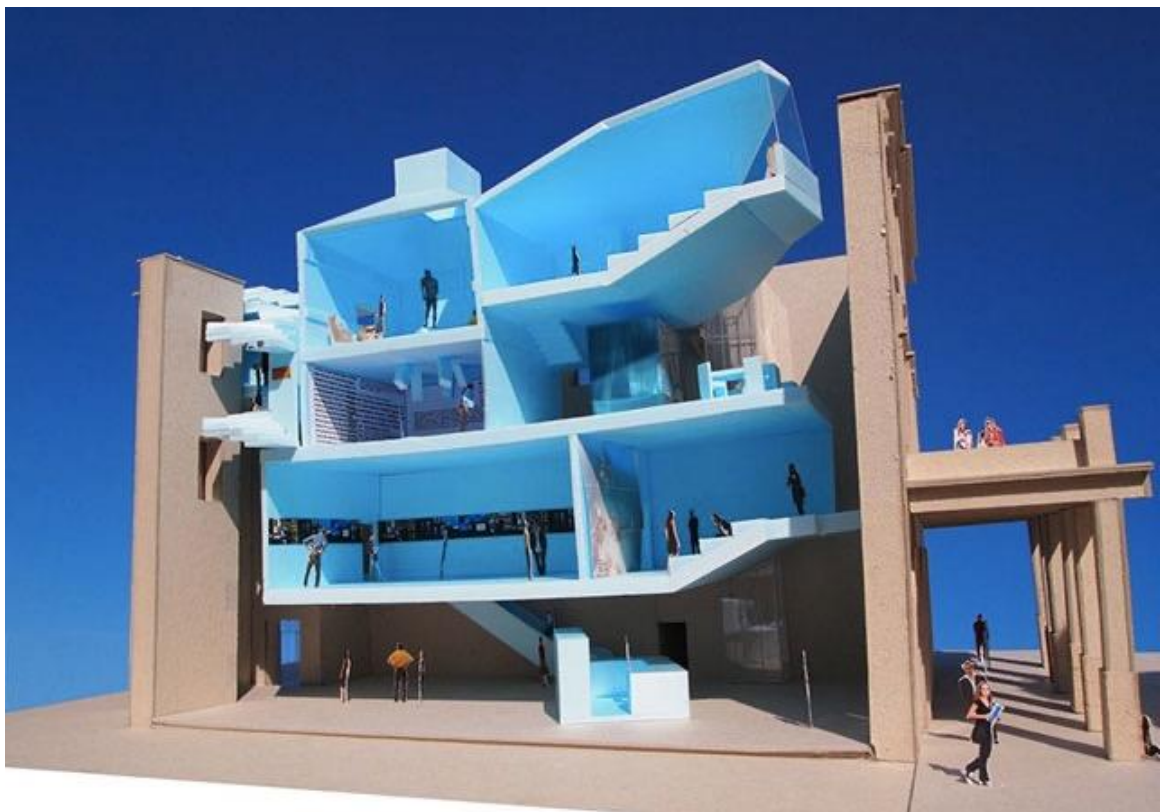
Слика 11. Музеј Апоксиомена, Мали Лошињ, 2016. (Идис Турато)