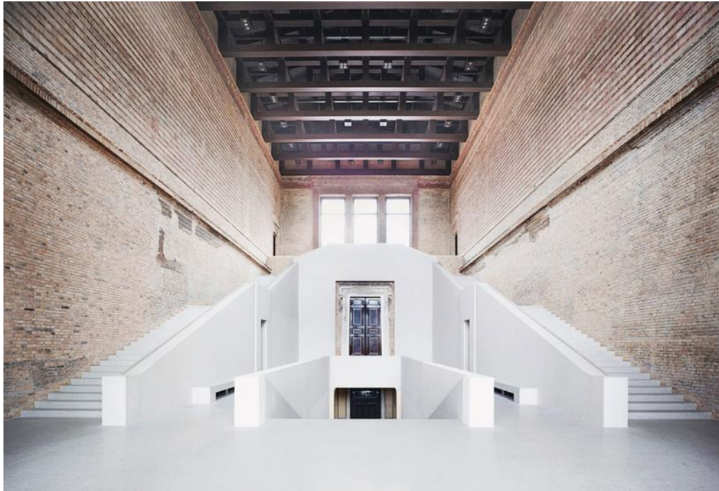
Слика 08. Музеј, Берлин, 2009. (Дејвид Чиперфилд)

Извор илустрације: https://www.archdaily.com/127936/neues-museum-david-chipperfield-architects-in-collaboration-with-julian-harrap