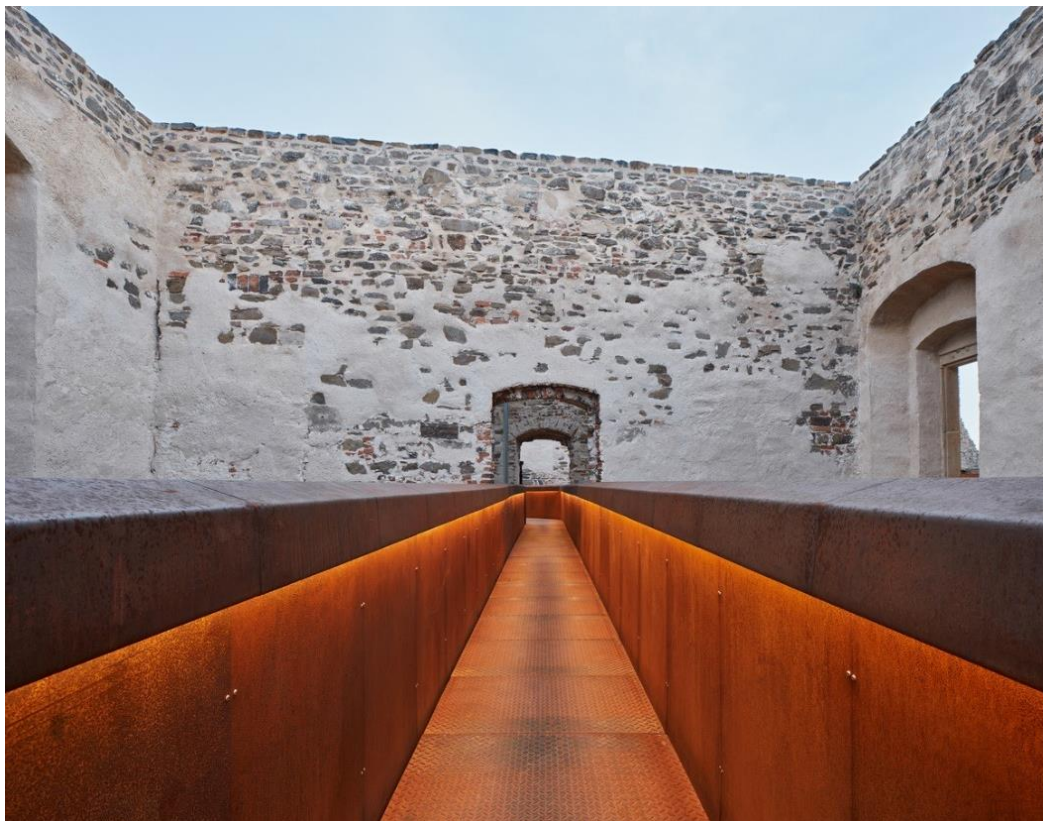
Слика 09. Замак Хелфстин, Чешка, 2020. (Атеље-р)