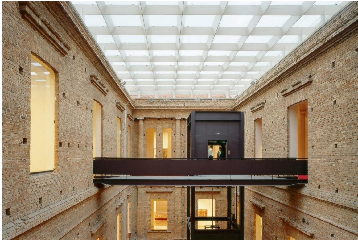
Слика 10. Пинакотека, Сао Паоло, 1998. (Пауло Мендес де Роха)